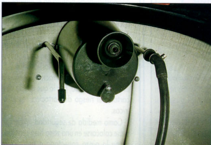
Depósito de succión por vacío.

La rapidez es una de las características que define a este tipo de equipos, ya que los lavados de las pistolas se realizan en tiempos que pueden oscilar entre 3 y 5 minutos.