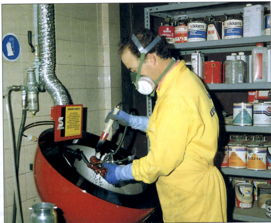
Utilización del equipo en la zona de pintura.