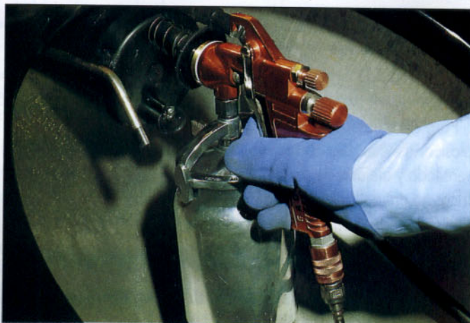
Colocación del pico de fluido sobre el depósito.