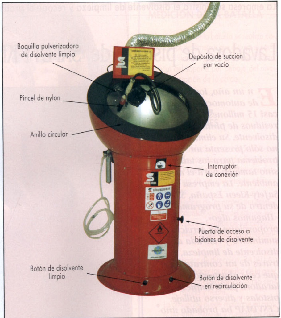
Partes fundamentales del equipo (vista anterior).

Una vez accionado el interruptor que pone en funcionamiento la bomba y, por ello, también la aspiración de gases, el primer paso consiste en eliminar los restos de pintura de la pistola, con la ayuda del