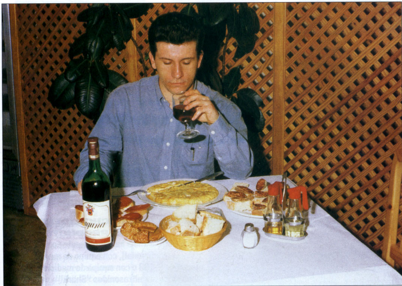
Las comidas copiosas y el alcohol no son buenos compañeros de viaje.

Revise, al menos, los niveles de aceite y agua con cierta periodicidad, y evidentemente, antes de iniciar un largo recorrido.