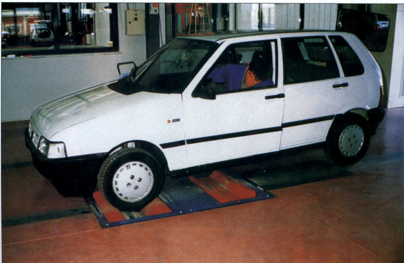
Seguridad activa: dirección, suspensión y frenos.

tuación extrema. Aunque su vida útil ronda los 60.000 kilómetros, conviene revisarlos regularmente y sustituirlos a la menor anomalía detectada.