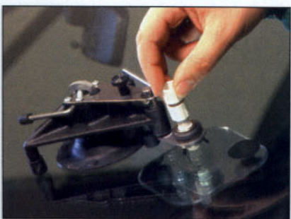
Inyección de la resina.

El acabado final de la reparación se consigue mediante un pulido de la zona con la ayuda del taladro y el pulimento "plastic polish" suministrado con el propio equipo.