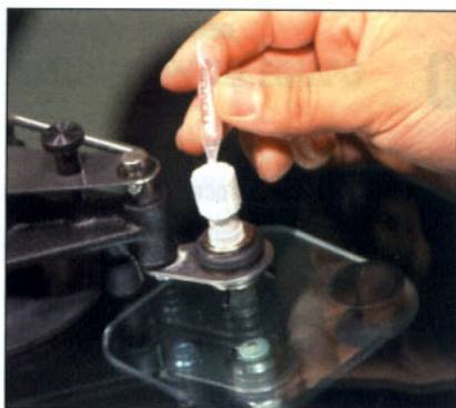
Vertido de la resina en el inyector.

de presión y succión, para facilitar la extracción del aire.