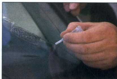
Reparación de una grieta por capilaridad.

- La resina endurece por la acción de los rayos ultravioleta. Por este motivo, es necesario almacenarla protegiéndola de la luz solar.