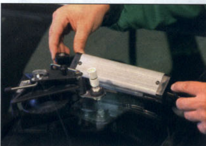
Secado de la resina con lámparas de rayos ultravioleta.

En este tipo de reparación no siempre es preciso utilizar el puente portainyector. La operación se realiza de forma sencilla, depositando progresivamente la resina sobre la grieta para que vaya penetrando por capilaridad, colocando posteriormente trozos de lámina plástica de celofan que impidan la penetración de aire en la misma y faciliten el secado de la resina.