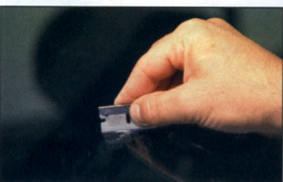
Eliminación de los restos de resina.

El secado de la resina se realiza con la lámpara de rayos ultravioleta, después del cual se eliminará el material sobrante con la cuchilla rascadora.