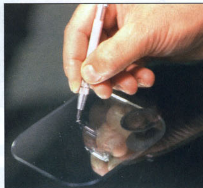
Con un punzón se localizará y limpiará el cráter de la rotura.

Antes de iniciar la reparación, ha de limpiarse la rotura y su zona adyacente con un papel o trapo limpio y seco. Para esta