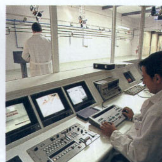
Zona de impactos y sala de control de Cevimap

estructura de la parte frontal del vehículo influye de manera determinante en las consecuencias de un atropello.