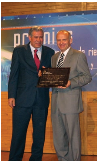
Entrega del premio regional a la prevención de riesgos laborales