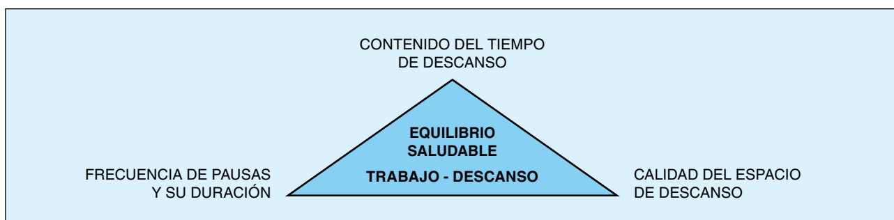
Figura 1. Componentes esenciales para la efectividad del descanso

El descanso podrá desarrollarse en condiciones satisfactorias y debidamente controladas siempre que se disponga del tiempo y la frecuencia necesaria, del espacio idóneo y de suficiente calidad en su contenido, o bien, será deficitario, repercutiendo negativamente en el trabajo y en la propia persona. Ver esquema de la figura 1.