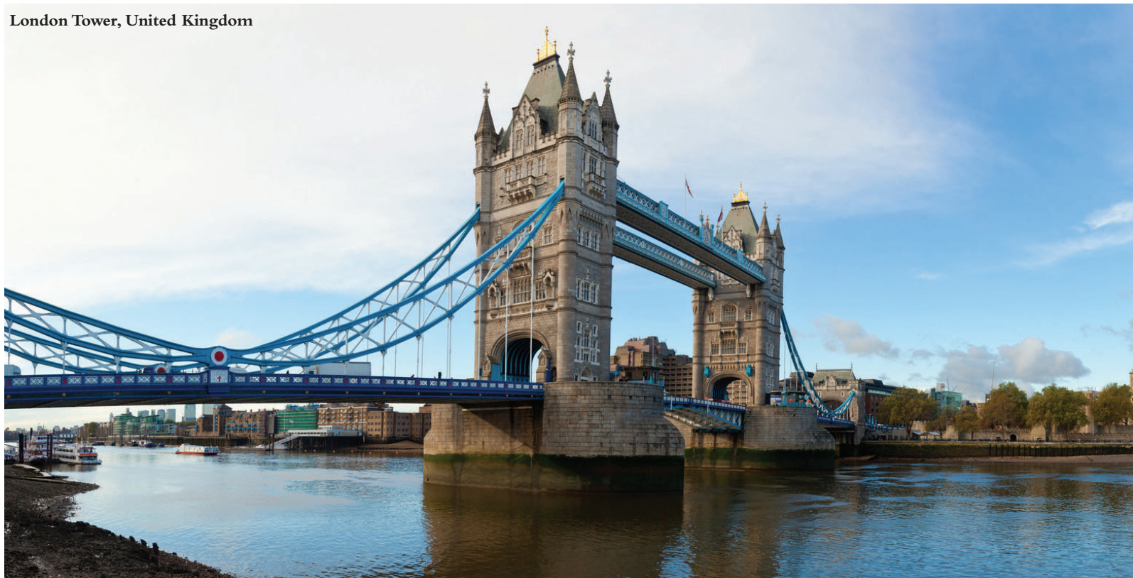
London Tower, United Kingdom

towards convergence and unification, the most visible of which made real in the European Union. However, in spite of these efforts, Europe continues to be characterised by diversity: its population comes from different ethnicities and cultures, communicates in over 200 languages (although 10 are predominant) and is spread out over 47 countries.