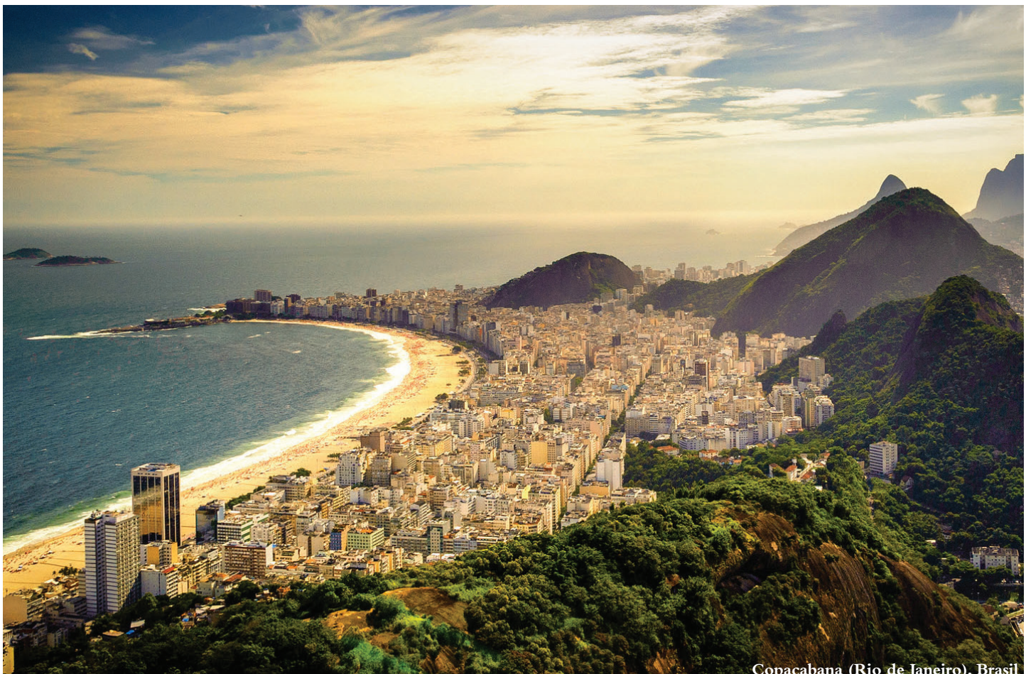
Copacabana (Rio de Janeiro), Brasil

A nível político, a entrada em vigor de nova legislação introduziu igualmente incentivos. As novas regras a nível do Código Civil de 2002 vieram estabelecer regras claras em termos de responsabilidades. Finalmente, também crucial foi a abertura do mercado ressegurador em 2008. Como resultado, os novos players passam a ser bem mais seletivos na sua tomada de risco.