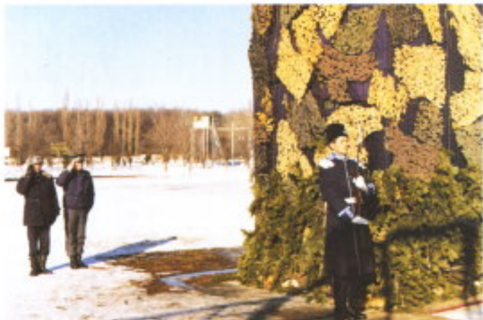
"Un ejemplo de marcialidad".