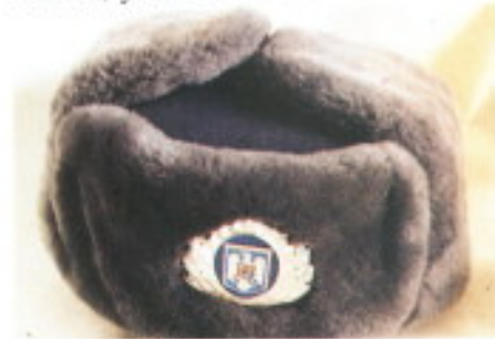
Prenda de cabeza para el frío.

En total la Gendarmería Rumana cuenta con unos 3.000 puestos en todo el territorio nacional, con unos 50.000 hombres