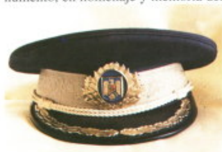
Gorra de oficial.

Cuenta con 6 Centros de Instrucción Básica, y un Centro de Perfecciona-