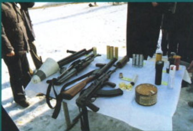
Diferentes momentos de la exhibición de defensa personal, control de masas, medios antidisturbios pesados, ejercicios de potencia, material antidisturbios y ejercicio anti-terrorista