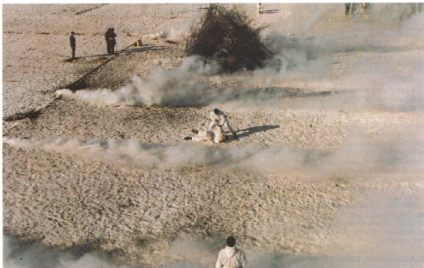
Ejercicio con fuego real

Se continuó con un simulacro de secuestro, en el interior de una vivienda, con posterior liberación de los rehenes, y abatimiento de sus secuestradores. También hubo ejercicios de paso de obstáculos en pista, con explosiones y