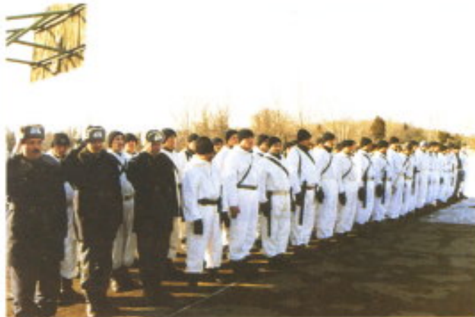
Comienzo de la exhibición.

nas, un tricornio y algunas figuras de guardias civiles que se exponían como recuerdos, junto con otras policías.