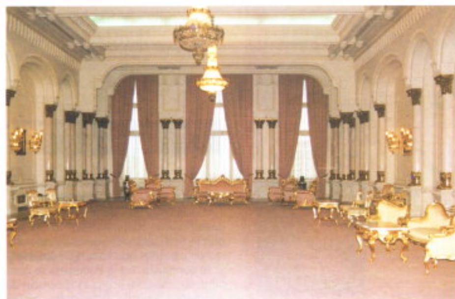
Servicio exterior del Palacio del Pueblo e interior (antiguo Palacio de Ceaucescu)