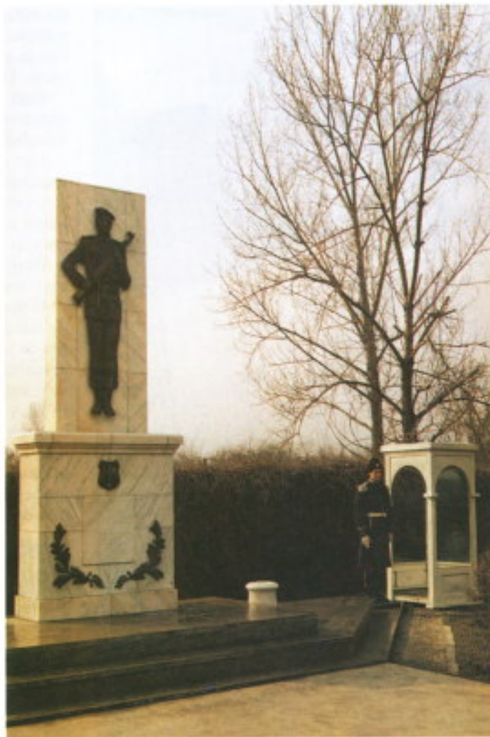
Monumento a la Gendarmería Rumana.

En el cruce de la carretera que conduce a aquel, con la autopista que lleva al aeropuerto, este Cuerpo tiene un monumento, en homenaje y memoria del