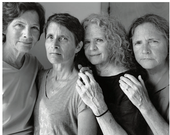
Nicholas Nixon, The Brown Sisters (Las Hermanas Brown) , 1975 – 2016