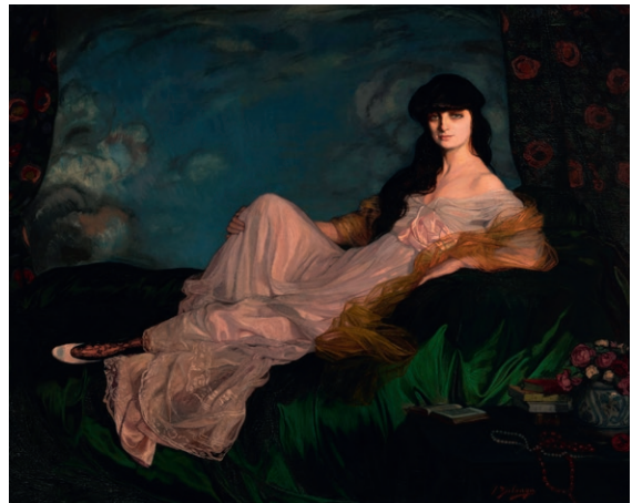
Ignacio Zuloaga, Retrato de la condesa Mathieu de Noailles , 1913 Museo de Bellas Artes de Bilbao

Y si lo tuyo es la fotografía, no dejes de visitar la exposición de Nicholas Nixon , que abrió sus puertas al público a partir del 14 de septiembre en la sala Bárbara de Braganza en Madrid.