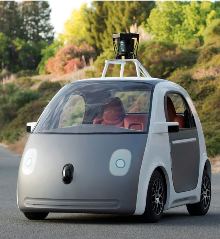
► Nivel 5, donde el conductor no es necesario