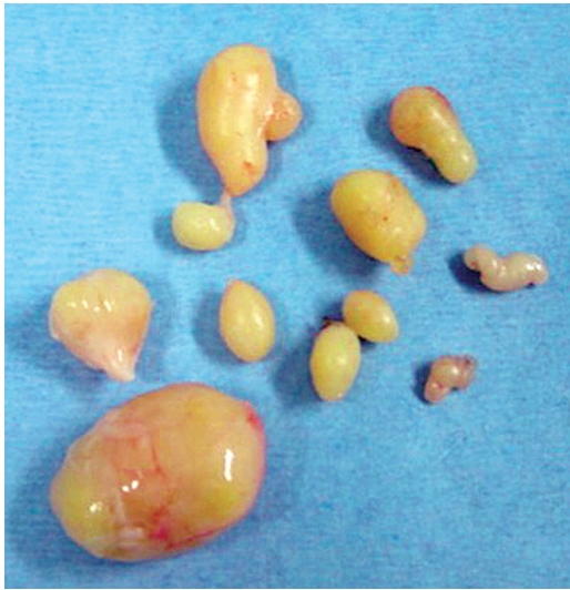
Fig. 1. Aspecto macroscópico de los once schwannomas extraídos.