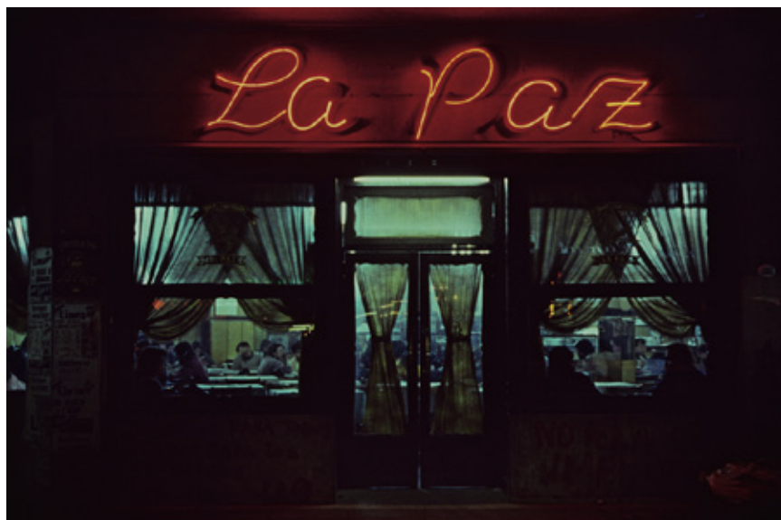
La Paz, Buenos Aires, 1986

Posar la mirada sobre las fotografías de Zuviría es una manera de repasar la historia de Buenos Aires y, por tanto, de Argentina.