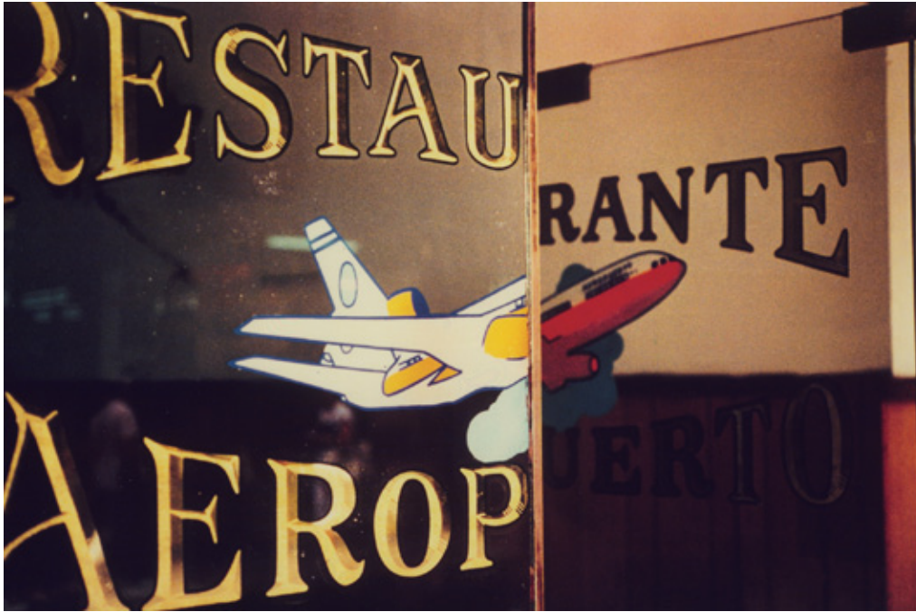
Aeropuerto, Microcentro, 1988

La ciudad nos habla a través de las huellas que van dejando sus habitantes en ella, de las marcas y los elementos gráficos que hay en el espacio urbano.