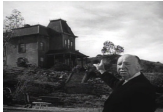
Alfred Hitchcock delante de la casa en la que se rodó Psicosis en 1960

El arte representa la realidad, pero a veces la realidad se crea a partir del arte. (Si no conoces el cuadro puedes verlo clicando sobre el título).