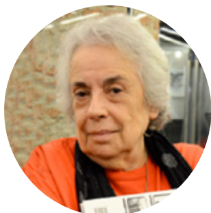
Colita, fotografía de Judesba

Martha Rosler (1943) es una artista neoyorquina pionera en el uso del vídeo y de la fotografía en los años setenta. En su obra muestra su preocupación por los cambios urbanos y el papel de la fotografía documental. Rosler comparte con Zuviría su interés por explorar los cambios que experimenta la ciudad, por ejemplo, en su obra The Bowery in Two Inadequate Descriptive Systems (1974-1975) documentó la decadencia de un barrio del centro de su ciudad, Nueva York. Las fotografías fueron tomadas por ella a lo largo de la famosa calle Bowery, en el sur de Manhattan, identificada por el alcoholismo y por colectivos marginados pero también habitada por artistas y pequeños espacios culturales. A través de estas representaciones, la artista reflexionaba sobre la capacidad del medio fotográfico para convertirse en herramienta política, es decir, en un medio de denuncia, de pensamiento, de cambio. Rosler decidió no incluir personas en este proyecto, sino los rastros que dejaban tras de sí en el espacio. Fue una práctica contra-documental, en otras palabras, un rechazo a las imágenes que algunos fotógrafos, socialmente comprometidos pero privilegiados, hicieron de los más desfavorecidos, como los inmigrantes y los trabajadores.