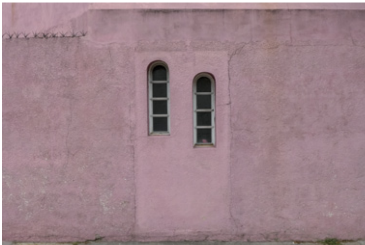
Ochava rosa con dos ventanas, Buenos Aires, 2017

Algunos de los proyectos de Zuviría se prolongan en el tiempo, como ocurre con su serie de fachadas, que confiesa no poder dejar de fotografiar cada vez que descubre una.