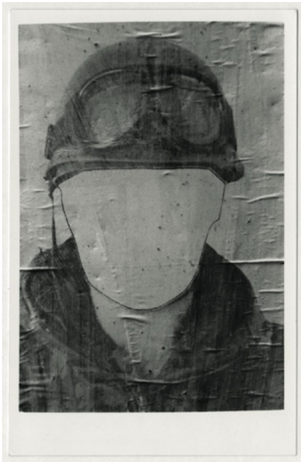
Las Malvinas, ca. 1983

Facundo de Zuviría es un fotógrafo nacido en Buenos Aires en 1954. Es precisamente el paisaje urbano de su ciudad natal lo que inspira su obra. En sus imágenes de las calles y la arquitectura logra capturar los momentos más íntimos de la capital.