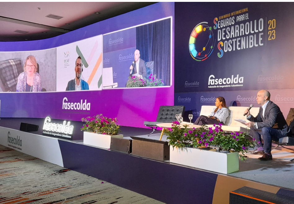
Panel: Estrategias de las compañías de seguros para responder a los riesgos y oportunidades del cambio climático