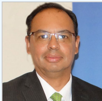
Carlos Luna Confianza Compañía de Seguros