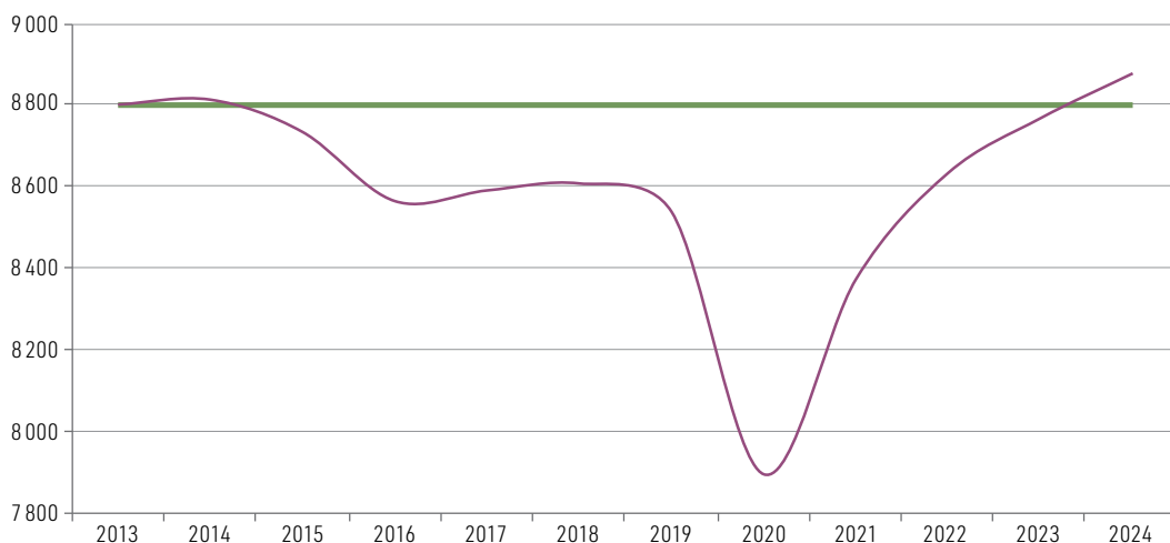
➤ Gráfico 2. América Latina y el Caribe: producto interno bruto per cápita, 2013-2024 (En dólares constantes de 2018)

Fuente: Comisión Económica para América Latina y el Caribe (CEPAL), sobre la base de cifras oficiales.