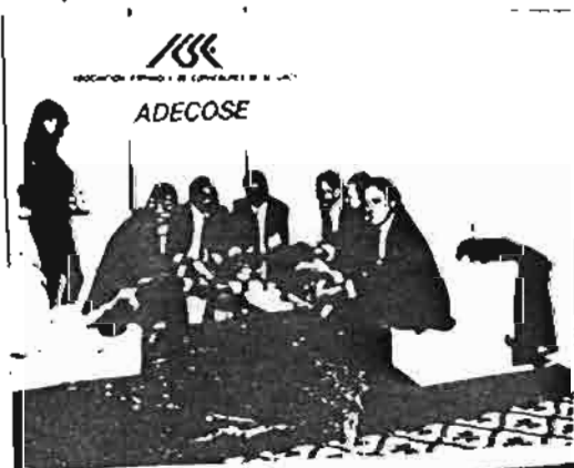
Vista General de las Exposiciones.