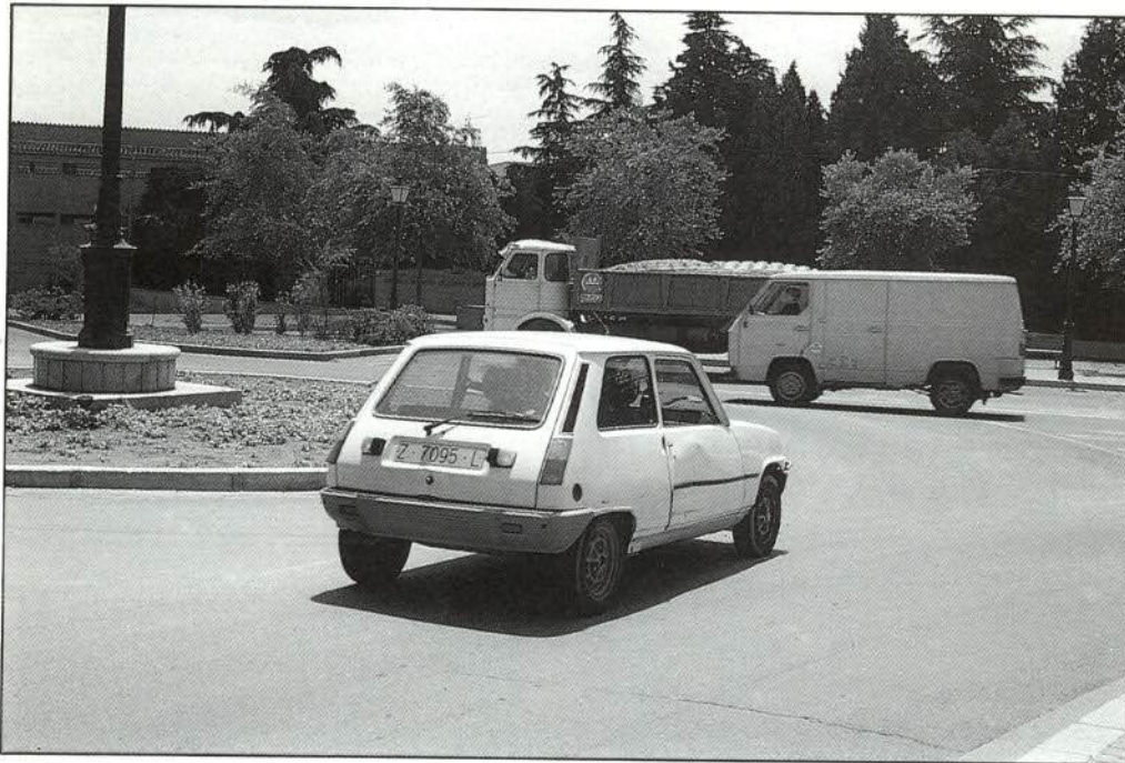
Figura 1: Circulación de vehículos.