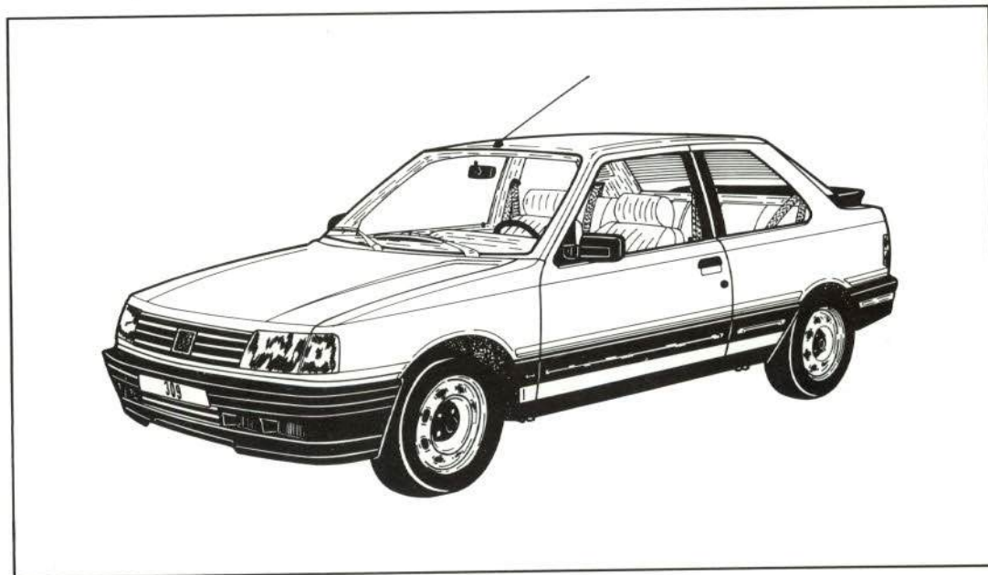
FIGURA 1.—Peugeot 309.

En el presente Boletín se indican las diferencias del número de chasis del PEUGEOT antiguo y del moderno y su aplicación en un modelo concreto: el 309.