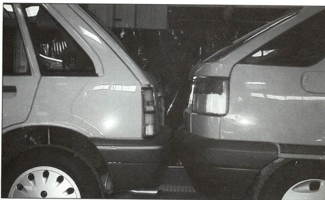
FIGURA 1.—Alturas de faros, pilotos y paragolpes.

Las medidas han sido tomadas con el vehículo vacío y con la presión de los neumáticos adecuada. Cualquier maniobra brusca en la conducción puede modificar las dimensiones indicadas; así, en un caso de alcance, las medidas del vehículo que choca con el que le precede pueden ser inferiores a las reflejadas en este boletín, debido a que el conductor probablemente haya efectuado una maniobra de frenado.