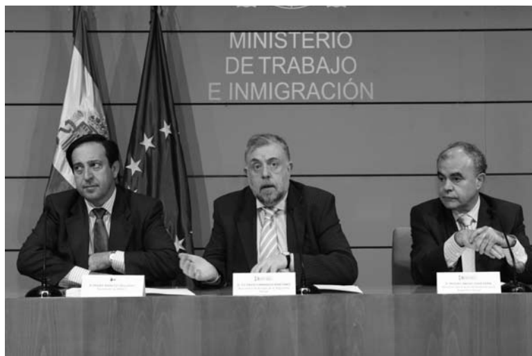
El Secretario de Estado de Seguridad Social, Octavio Granado y representantes de la Asociación de Mutuas, en la reunión de octubre de 2008.

La oficina virtual se complementará con un servicio de atención telefónica de línea 900, que informará a los trabajadores sobre las prestaciones que ofrecen las mutuas.