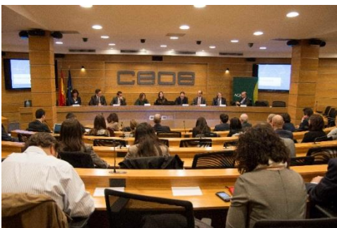
Mesa presidencial y público. Foro de Biomedicina: Big Data en los Seguros Personales, en la sede de

La Asociación Española de Gerencia de Riesgos y Seguros (AGERS) celebró el pasado 4 de diciembre, el Foro AGERS de Biomedicina “Big Data en los Seguros Personales” sobre el conjunto de datos que los internautas dejan en la red y los cambios que esta realidad está provocando en el sector de los seguros personales.