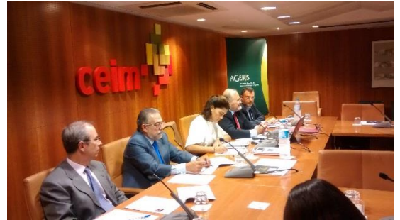
Aula Compliance 30 de septiembre

Durante estas dos jornadas, la del 10 exclusiva para asociados y la del 30 abierta a todo el público, se trataron diferentes aspectos del compliance y se dio respuesta a cuestiones como: ¿Qué es el compliance? ¿Cuáles son los fundamentos jurídicos de la gestión de riesgos? ¿Cómo ayudan las normas de buen gobierno corporativo a la gestión integral de riesgos? ¿Quién es el Compliance Officer? o ¿Cómo cumplir con la obligación legal de implementar el corporate compliance en las organizaciones?