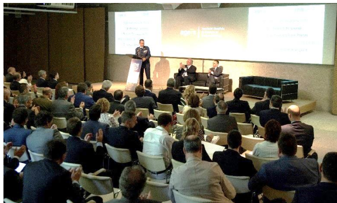
De izquierda a derecha General D. Manuel Gimeno, D. Gonzalo Iturmendi y D. Juan Carlos López Porcel

La UME nace el 7 de octubre del año 2005, cuando el Gobierno de España decidió crear una Unidad Militar de Emergencias conjunta, organizada, adiestrada y dotada de material e infraestructura para preservar la seguridad y bienestar de los ciudadanos en caso de catástrofe, calamidad, grave riesgo u otras necesidades públicas.