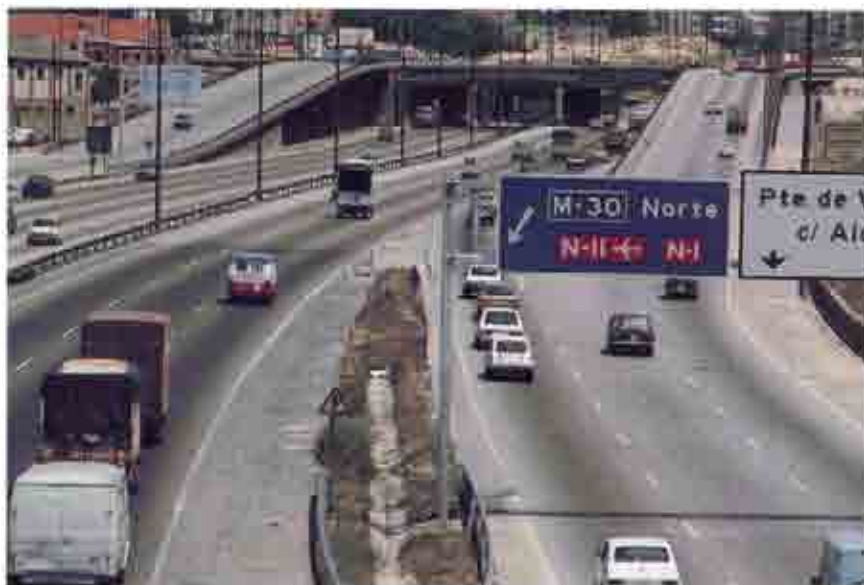
Se recomienda facilitar la maniobra a los vehículos que se incorporan a la circulación

por la concurrencia con las graves simples, de «circunstancias de peligro», pues determinadas conductas deben ser sancionadas de forma muy contundente y ejemplarizadora, aunque no existiera esa circunstancia añadida.