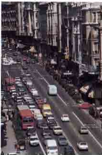
Se deberían imponer fuertes sanciones a aquellos conductores que circulan con vehículos que no han pasado por las inspecciones técnicas, por el riesgo que representan para los otros usuarios.

Sin embargo, tengo el convencimiento que la acción más eficaz para la reducción de la siniestralidad del tráfico es una decidida lucha contra la ingestión de alcohol y de drogas, como ha quedado demostrado en