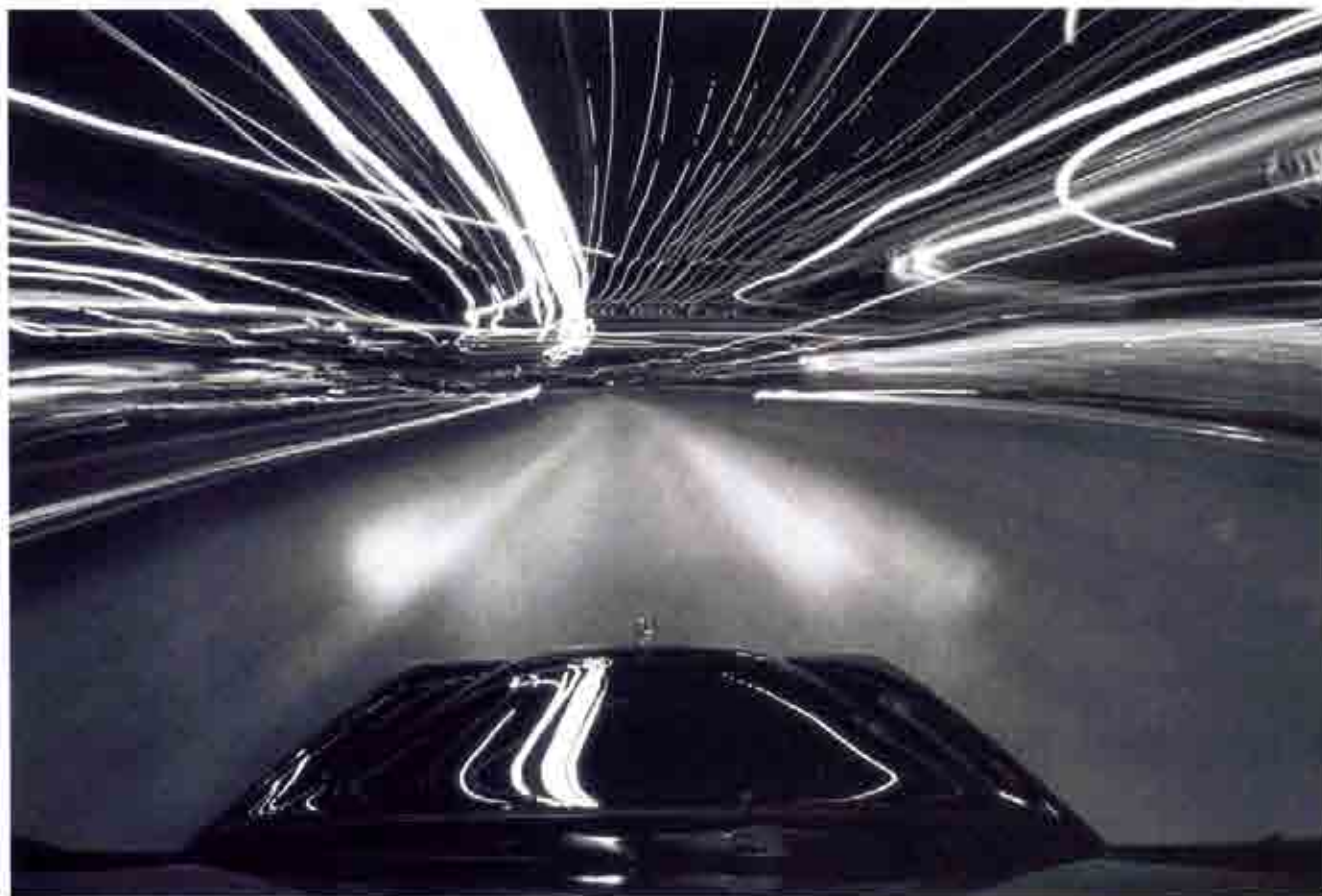
Otras conductas que por sí mismas constituyen graves peligros para los usuarios de la vía, son la conducción temeraria o carreras entre conductores.

otros países que han hecho frente al problema con resultados espectaculares.