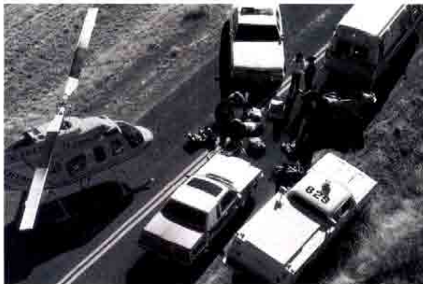
Los conductores implicados en accidentes deben someterse a las pruebas de detección de intoxicación etílica o de estupefacientes.

La norma sobre la excepción de realizar adelantamiento por la izquierda y si por la derecha cuando el