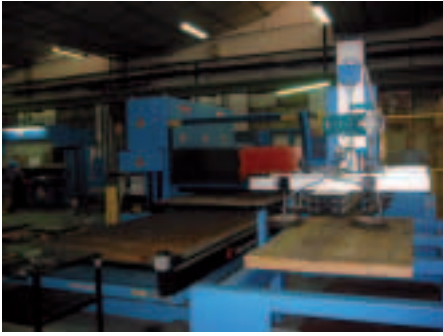
Láser clase IV tipo CO 2 de corte de materiales metálicos de espesores entre 1 y 20 milímetros, en industria del sector metal-mecánico.

► Procesos de ensayo y control , para aplicaciones de investigación y desarrollo, en la cámara de combustión de motores de cuatro tiempos para estudio del quemado de la llama.