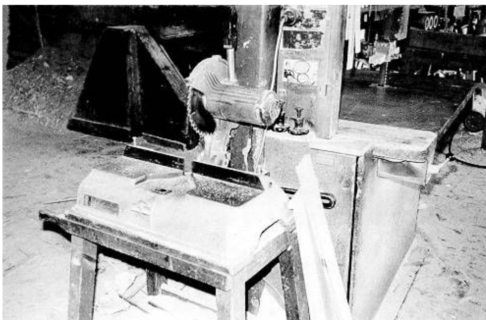
Fig. 2: Tronzadora con el disco accesible y discontinuidad en la superficie de la mesa de apoyo

Normalmente, para la ejecución de estas operaciones, el operario sujeta manualmente la pieza con la mano izquierda, mientras que con la mano derecha acciona la palanca de descenso del disco. La aparición de un nudo que varíe la resistencia a la penetración provoca una sacudida brusca en la pieza si ésta no permanece sólidamente fijada a la mesa y consecuentemente la posibilidad de que la mano del operario que la sujeta se precipite hacia el disco y entre en contacto con el mismo si permanece accesible. Asimismo, este riesgo aparece en operaciones de corte de testas en piezas de corta longitud en tronzadoras cuya mesa de apoyo presenta una discontinuidad en su superficie para realizar los ingletes (figura 2). Al penetrar el disco en la pieza, ésta puede caer en la oquedad de la mesa si previamente no se ha garantizado su sólida fijación y consecuentemente arrastrar la mano que la sujeta, entrando en contacto con el disco si permanece accesible.