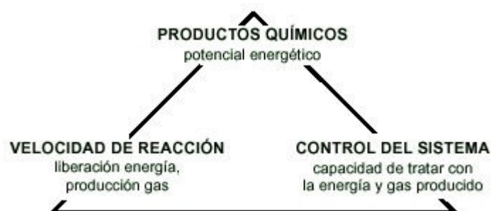
Figura 2. Factores que determinan el diseño de un proceso químico seguro

Hay tres ámbitos principales de análisis que determinan el diseño de un proceso químico seguro (figura 2).