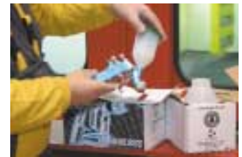
Presentación de una pistola aerográfica

Del buen uso que el pintor haga de esta completa información dependerá la calidad del trabajo ✘