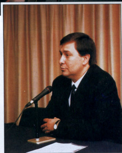
Diversos momentos de la presentación de CESVIMAP (24 de mayo) a los sectores de la post-venta de vehículos y de la reparación.