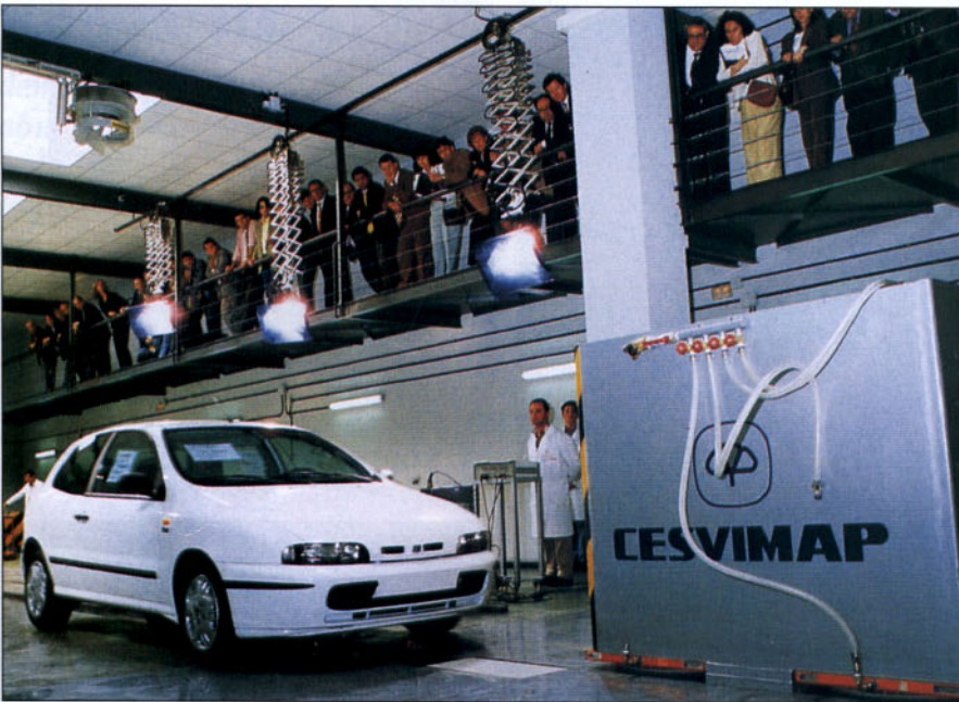
Diversas fases de la presentación a los medios de comunicación (27 de mayo).

distribución. Puso especial énfasis en aquellos aspectos novedosos, sobre todo en cuanto a espacios y equipamientos, que son fruto de la experiencia adquirida en las viejas instalaciones; por ejemplo, en las oficinas técnicas, la luz y lo diáfanos que son; en las aulas, la versatilidad y dotación de medios; en las aulas-taller, el aislamiento y la suficiencia de equipos; en el taller, la ergonomía de los puestos de trabajo así como la estructura de la cubierta que permite tener más de 2.000 m 2 ; desta-