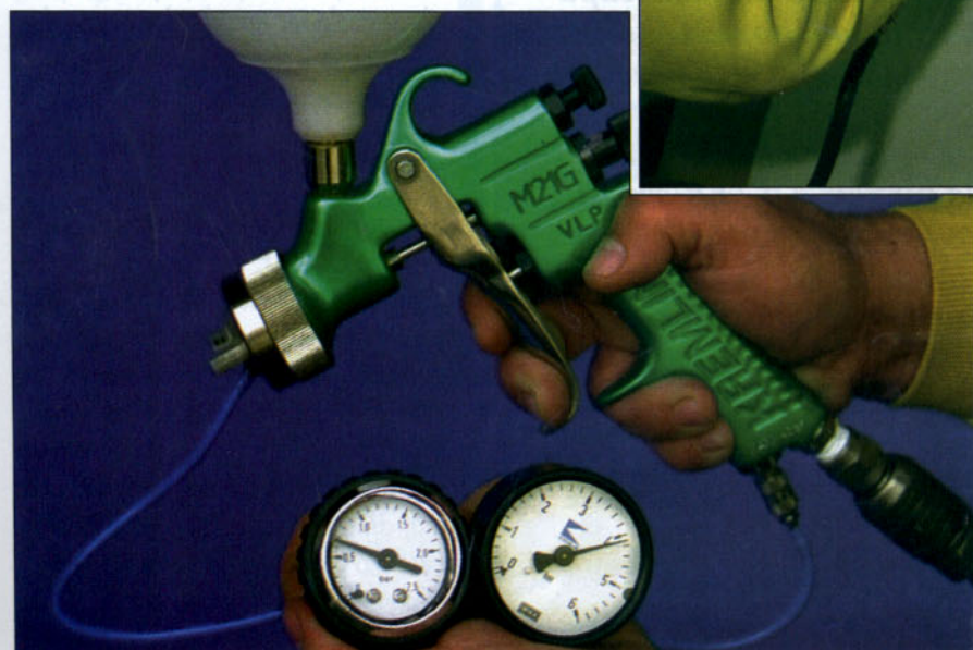
Una vez ajustada la presión debe hacerse un patrón de pulverización.

de gravedad ya desmontado, y se colocan en el interior de una lavadora, después de girar una vuelta el casquillo de aire y trabar el gatillo. De esta forma el disolvente limpio fluye por los conductos del cuerpo de la pistola por donde antes pasó la pintura y así éstos quedan perfectamente limpios. Posteriormente, se seca con un paño limpio y seco y se lubrican las zonas anteriormente mencionadas si no se fuese a utilizar en un breve período de tiempo.