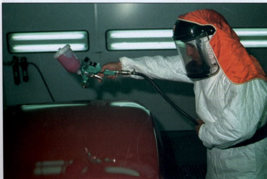
Trabajando con bajas presiones se reduce la niebla de aplicación.

• Está diseñada para la aplicación de imprimaciones, aparejos y pinturas de acabado, siendo con éstas últimas donde se ha observado un mejor comportamiento. Sólo es necesario seleccionar boquilla, pico de fluido y aguja específicos para cada tipo de aplicación. ■