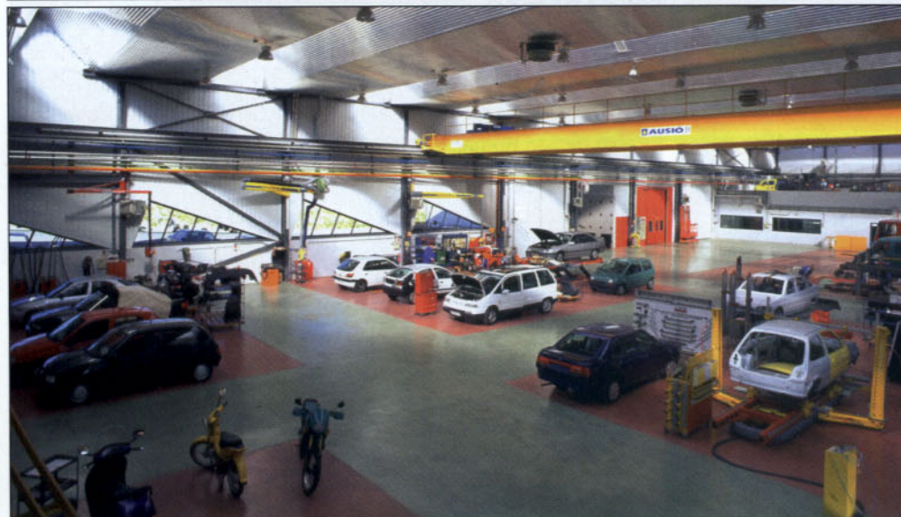
Los talleres responden a concepciones diferentes.