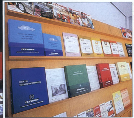
Los soportes de divulgación han evolucionado a la par que la demanda.