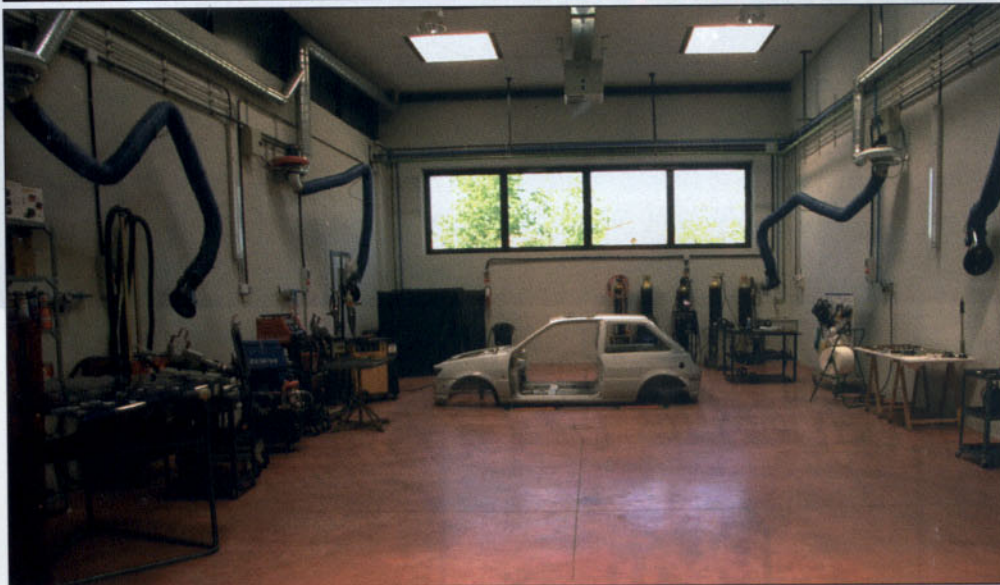
Los medios didácticos siempre han buscado el mayor poder de transmisión.

Betacam, pasando por U-matic; de apenas 1.600 m 2 a más de 18.000 m 2 ; de un centro de trabajo a cuatro, además de la expansión internacional; de dos cursos simultáneos, en el mejor de los casos, a los seis o siete que actualmente se imparten; y así lo que sería una larga relación de pequeños hitos.