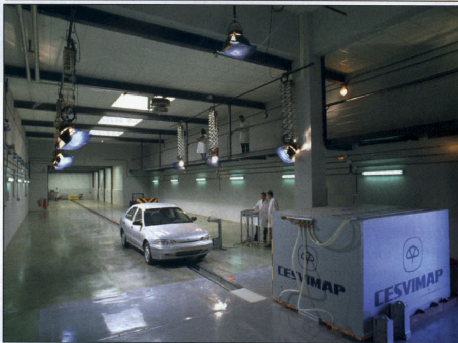
El sistema de producción de impactos ha variado sensiblemente.