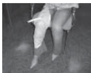
Vendaje de rodilla