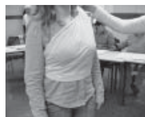
Vendaje de tórax (o espalda)