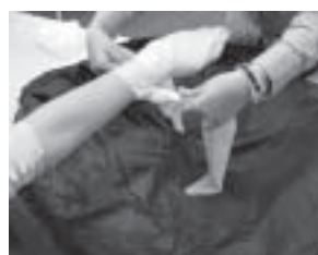
Vendaje de mano