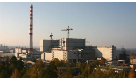
Central nuclear de Leningrado-II (Rusia)

El primer reactor de este nuevo modelo se inició a principios de este año en Novovoronezh-II para ser concluido en 2012. Un año más tarde, deberán funcionar las segundas unidades de ambas centrales. En la de Leningrado-II hay planificados otros tres reactores más.