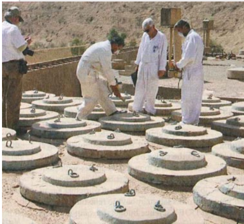
Expertos iraquíes midiendo la contaminación radiactiva en pozos de almacenamiento de residuos.

dad Técnica de Texas había inspeccionado los escombros y los edificios no dañados por los bombardeos, así como los remolques anejos, muchos de ellos con-