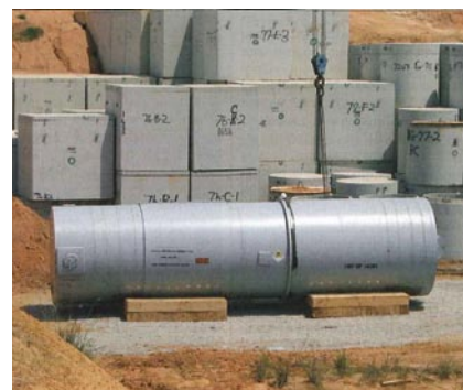
Vasija de reactor