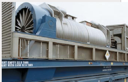
Cápsula mixta de transporte (TAD)

El concepto de cápsula mixta de transporte y almacenamiento temporal y definitivo, en inglés TAD, anunciado en 2005 por el Departamento americano de Energía (DOE), fue ideado para reducir la necesidad del manejo repetido del residuo de alta actividad o del combustible irradiado desde el origen hasta el repositorio profundo de Yucca Mountain, eliminando en la práctica una amplia superficie de almacenamiento y una compleja instalación de cambio de los residuos de diversos contenedores al contenedor final, con el consiguiente ahorro económico, de trabajo y de tiempo.