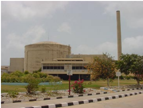
Central Nuclear de Kanupp (Pakistán)

en la provincia de Ninh Thuan y en enero de 2009 entraría en vigor una ley nuclear.