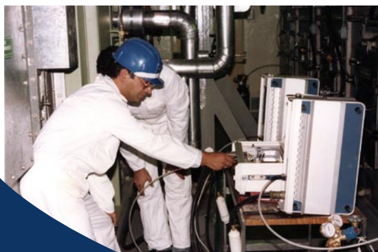
El renacimiento nuclear necesita personal preparado