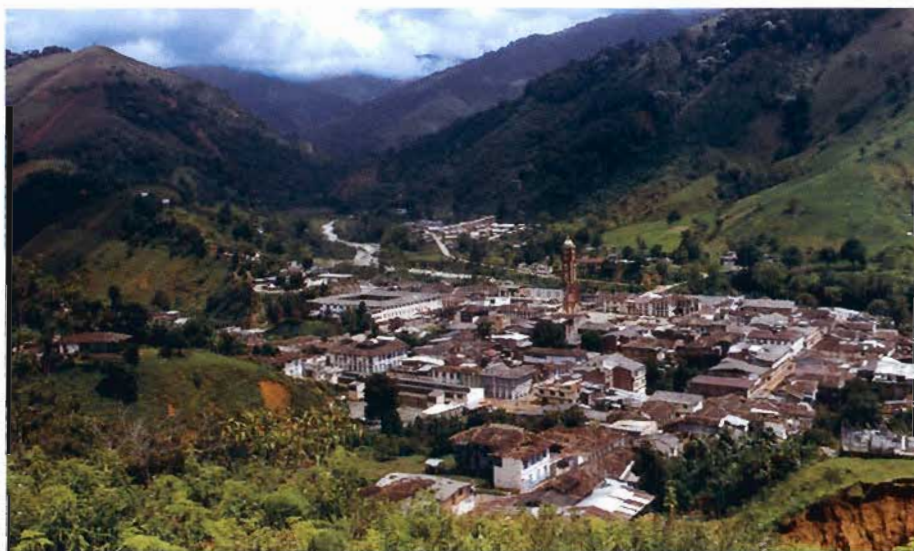
Población de Pijao, Quindío, una de las zonas afectadas.

La labor de los aseguradores nacionales de ajustar e indemnizar los siniestros que se presentaron con ocasión del terremoto se destaca por el hecho de que