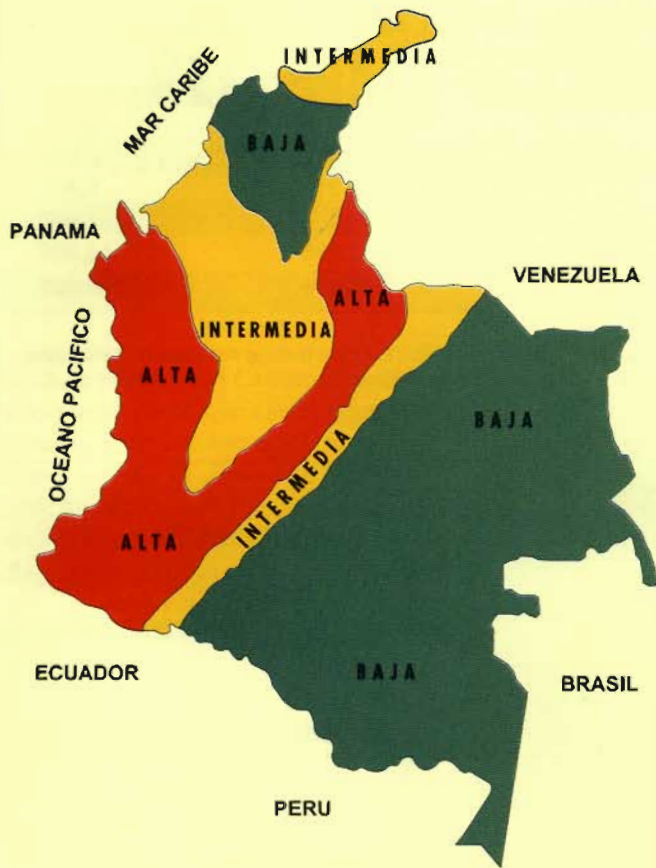
Fuente: Código Colombiano de Construcciones Sismorresistentes, 1998.

millones. En vivienda solamente el costo directo se calcula en US $1.330 millones.