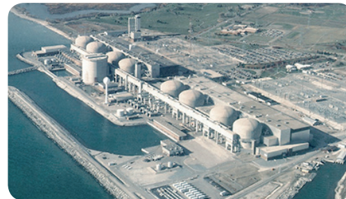
Central nuclear de Pickering

Según informó el regulador canadiense, Canadian Nuclear Safety Commission (CNSC), la autorización de las seis unidades operativas, que expiraba el 31 de agosto de 2013, se ha prorrogado hasta el 31 de agosto de 2018 con determinadas condiciones relativas a la realización de análisis probabilistas de seguridad y la publicación y difusión entre la población de un documento que detalle las medidas de respuesta ante emergencias.