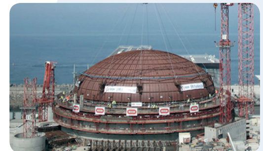
Instalación de la cúpula sobre el edificio del reactor.

Con este hito la construcción de la central entra en su fase final, habiéndose completado un 95 % de la obra civil y un 46 % de la instalación de equipos mecánicos y eléctricos y tuberías. En los próximos meses se instalarán los componentes pesados como la vasija del reactor y los generadores de vapor.