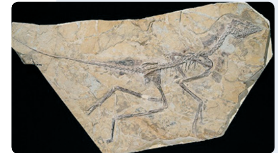
Aurornis Xui (© Science Magazine )

Fuentes: Science , 31 mayo 2013 y 7 junio 2013