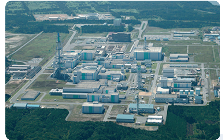
Planta de reproceso de Rokkasho

No se ha anunciado el destino del plutonio separado en el futuro. Japón ha optado por el ciclo cerrado con reactores reproductores pero actualmente va a emplear parte del plu-