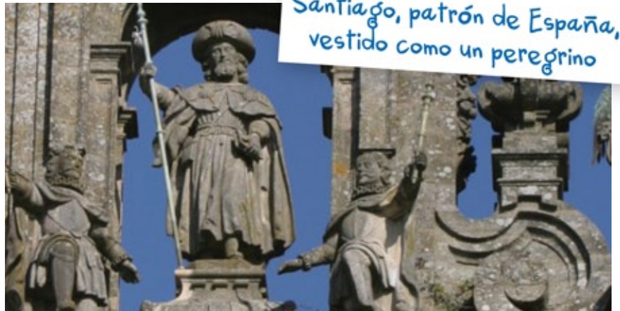
Santiago, patrón de España, vestido como un peregrino