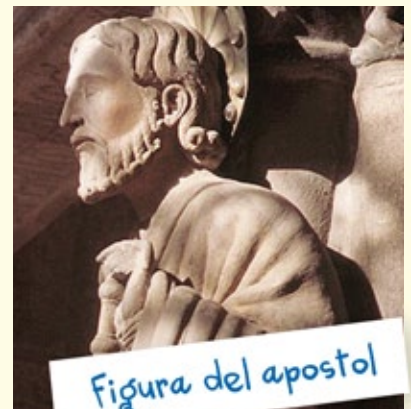
Figura del apóstol

Cuando entras en la catedral es lo primero que ves. El maestro Mateo tardó veinte años en terminarlo. Se compone de tres arcos sujetos por pilares y está decorado con muchas esculturas que representan escenas de la Biblia. Aunque ahora no lo estén, las figuras estaban pintadas con colores como azul, rojo y dorado. Hay apóstoles con instrumentos de música, animales mitológicos, etc. pero aparte de la imagen del apóstol, la más famosa es la