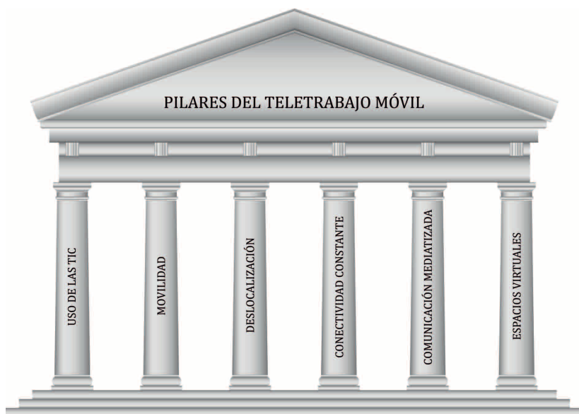
■ Gráfico 1 ■ Los pilares del teletrabajo móvil (adaptado de Berg, O. [11])

de una forma casi inmediata gracias al uso de internet.