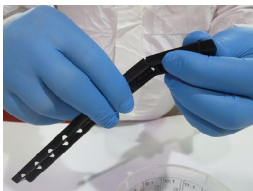
► Regla TURBOMIX