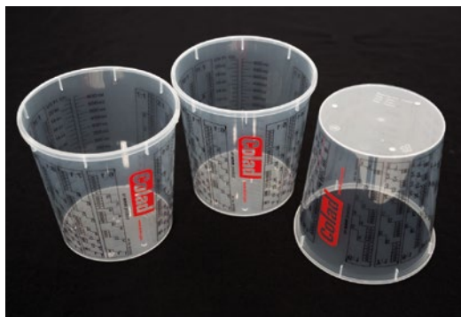
► Vasos y tapas