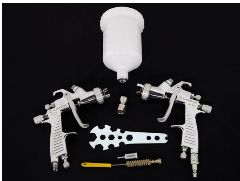
► Pistola HAMACH ESG

Al coger por primera vez una regla veremos que es una sola pieza, pero, a la hora de usarla, lo primero que hay que realizar es el corte en la parte más pequeña de la paleta. A partir de este momento, tendremos dos partes diferentes de regla. La parte más larga, o regla principal, se utilizará para remover la pintura después de realizar las diferentes mezclas de pintura. La otra parte, la más pequeña, se usará en la limpieza de la parte usada como removedor de las mezclas; de esta manera, se aprovecha todo el producto adherido en la regla principal.