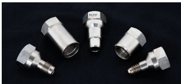
► Diferentes adaptadores

Proveedor: COLAD España Tel.: 620 837 646 Fax.: 917 513 217 ventas@emm.com