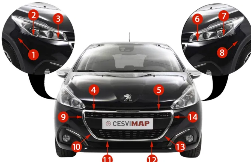
Comprobación de una pieza de recambio

Desde CESVIMAP se ha investigado sobre el recambio y su calidad, viendo cómo puede afectar a los procesos de sustitución de piezas en las áreas de carrocería, pintura y mecánica, comprobando su correcto funcionamiento y su comportamiento posterior ante un nuevo impacto.