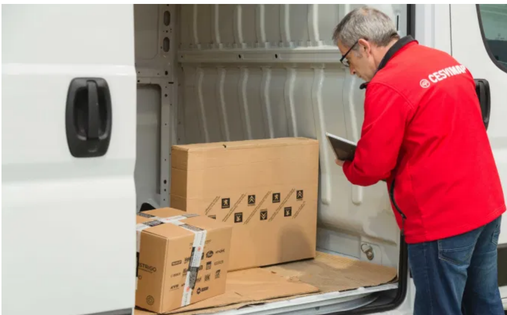
Jefe de taller verificando el recambio recibido

Para su correcta aplicación en las peritaciones es fundamental que se cuente con cruces de referencias fiables, que relacionen la pieza OEM con la pieza correcta OES / IAM, que se tenga el listado de PVP actualizado para su aplicación inmediata en la peritación y se pueda indemnizar por el valor de la reparación. También, que se garantice que detrás de cada referencia existe el canal apropiado de distribución del recambio, que permita completar la reparación sin incidencias.