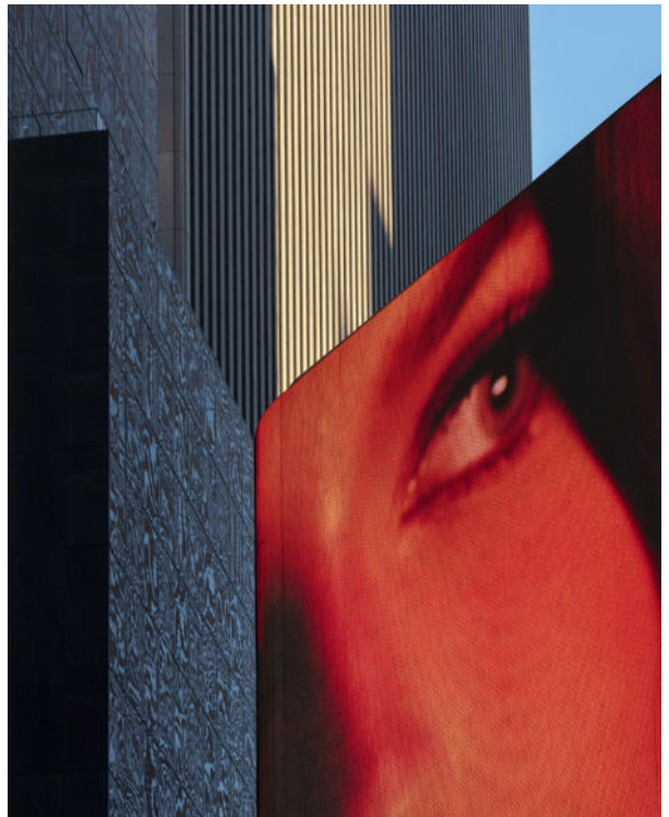
Anastasia Samoylova Red Eye, Time Square, New York, 2021 [Ojo rojo, Time Square, Nueva York]

En la época actual, de economías neoliberales, mercados financieros interconectados e imágenes globales, los centros internacionales económicos y culturales se están volviendo cada vez más parecidos. Sin embargo, ciudades como Nueva York, Moscú o Londres intentan promover su individualidad, a menudo dando un nuevo significado a su historia específica. A pesar de este deseo, todas estas ciudades se encaminan hacia un paisaje urbano genérico, de arquitectura anónima hecha de acero y vidrio, en el que las viviendas, las oficinas y las tiendas son todas iguales. El proyecto de Samoylova analiza de cerca el papel que juega la fotografía en la creación de esta brecha ideológica entre una identidad urbana de la que se presume y la realidad que muestran.