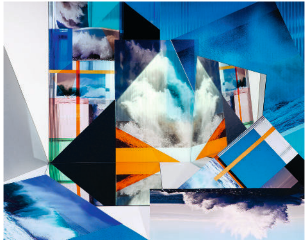
Anastasia Samoylova Crashing Waves , 2014 [Olas rompedoras] De la serie Landscape Sublime

Desde sus primeros trabajos una de las mayores preocupaciones de Samoylova ha sido la composición de sus imágenes, perfectamente estudiadas y con elementos superpuestos, fundamentales para obtener los resultados que busca. En la serie Landscape Sublime (iniciada en 2013), estos collages, creados con imágenes extraídas por norma general de internet y libres de derechos se imprimen, recortan, ensamblan, montan y se llevan a lo tridimensional para volver a lo bidimensional una vez fotografiados, en un proceso de trabajo en el que se privilegia lo manual y artesanal.