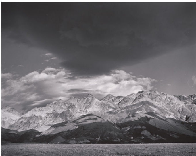
Nubes, Death Valley, 1939.

Fundación MAPFRE presenta la exposición Edward Weston. La materia de las formas , dedicada a las más de cinco décadas de trabajo de este artista estadounidense, una de las figuras más relevantes de la fotografía moderna.