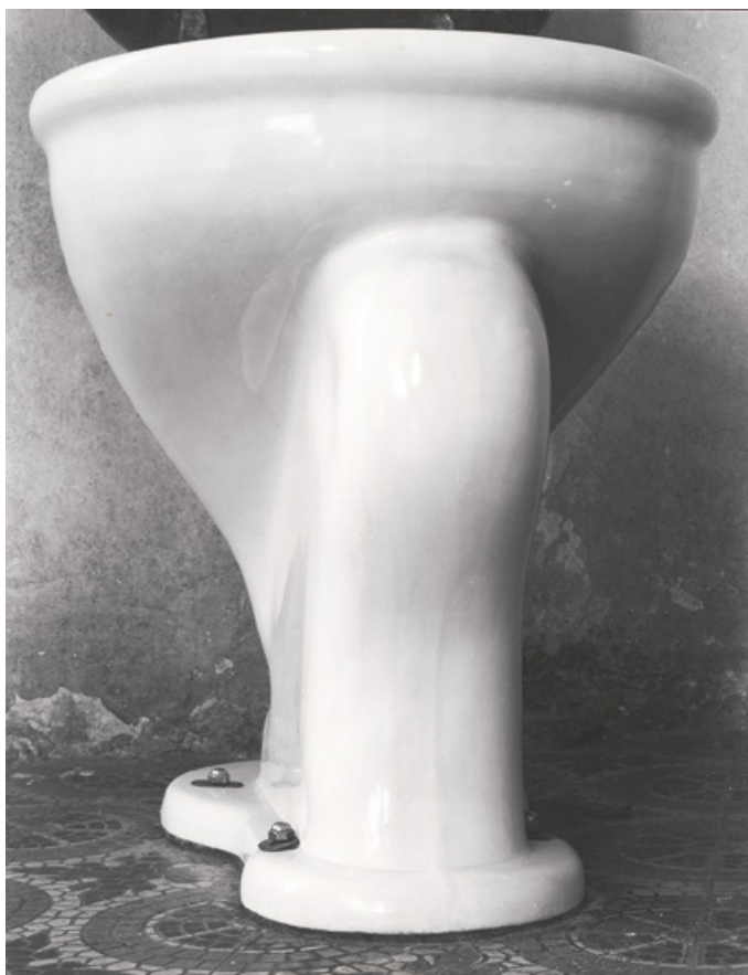
Excusado, México. Octubre de 1925.