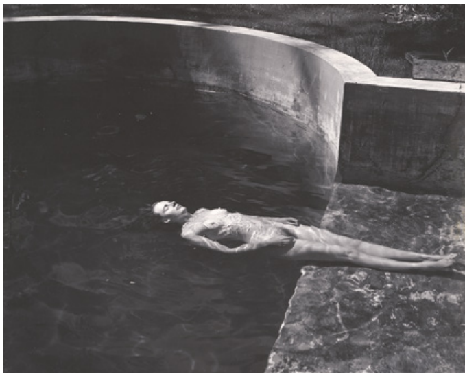
Desnudo flotando, 1939.