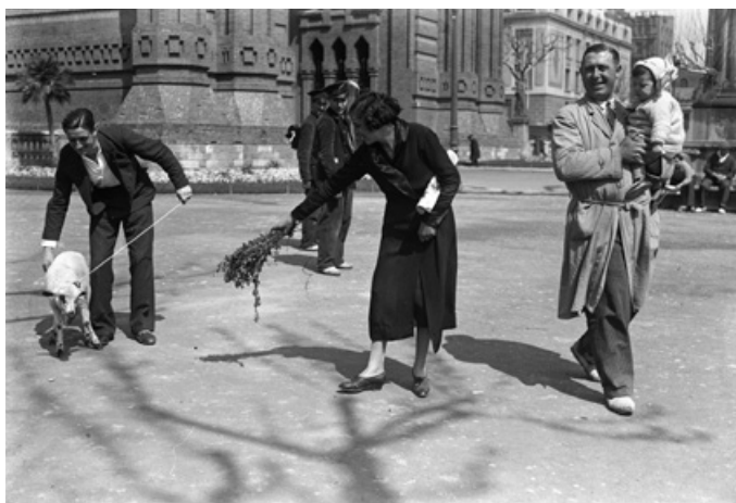
Borrego resistiéndose. Feria del Cordero en el paseo de Sant Joan de Barcelona durante la celebración de la Pascua, abril de 1934.