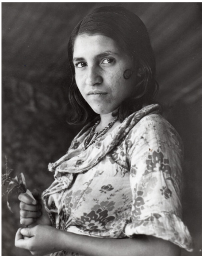
Retrato de una niña polaca, La Vanguardia , 9 de junio de 1935.