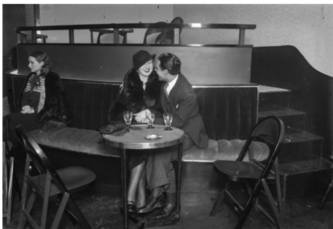
Una pareja en un bar de Barcelona, 1931-1936.