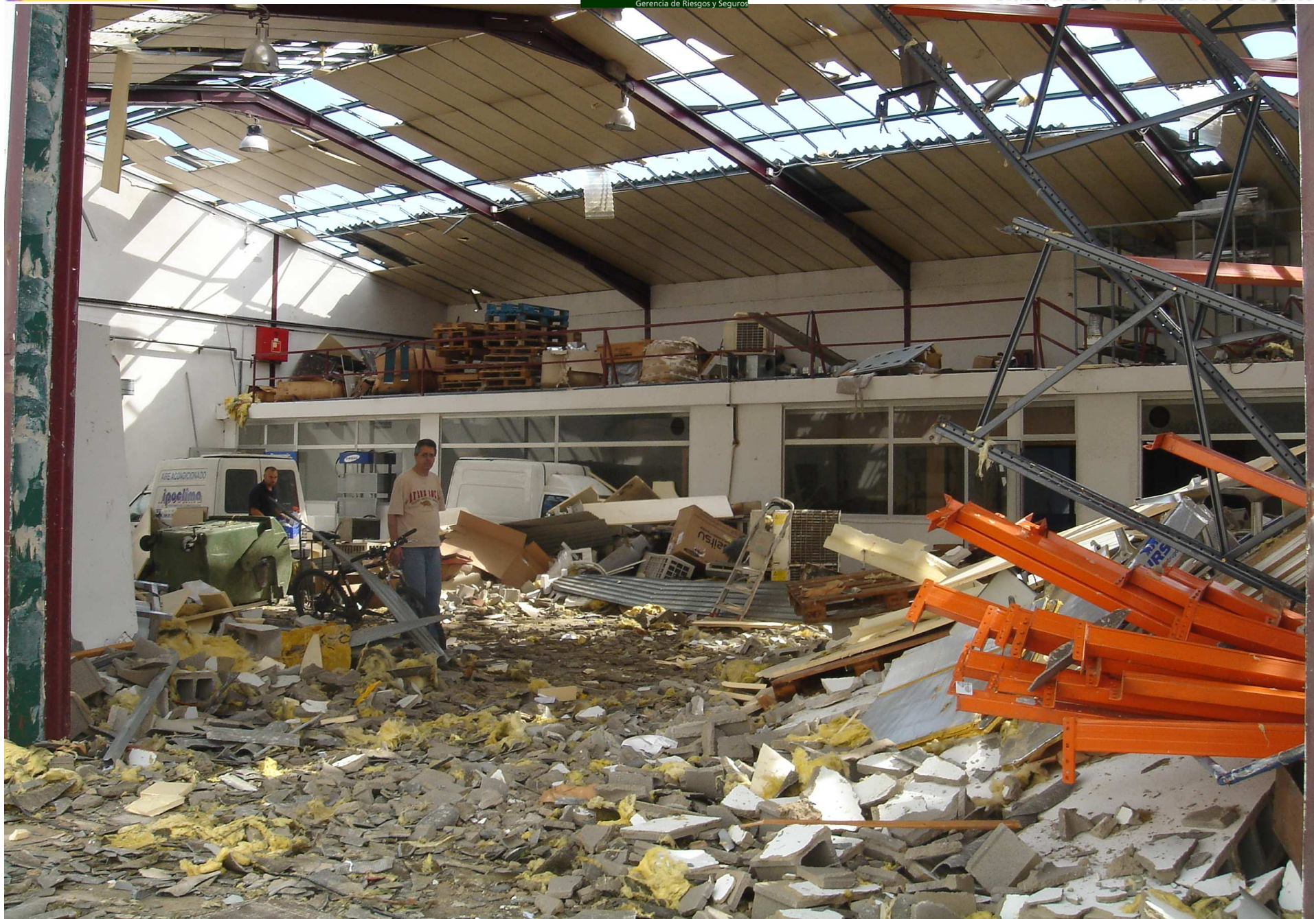
Donación de AGERS al Centro de Documentación de Fundación MAPFRE