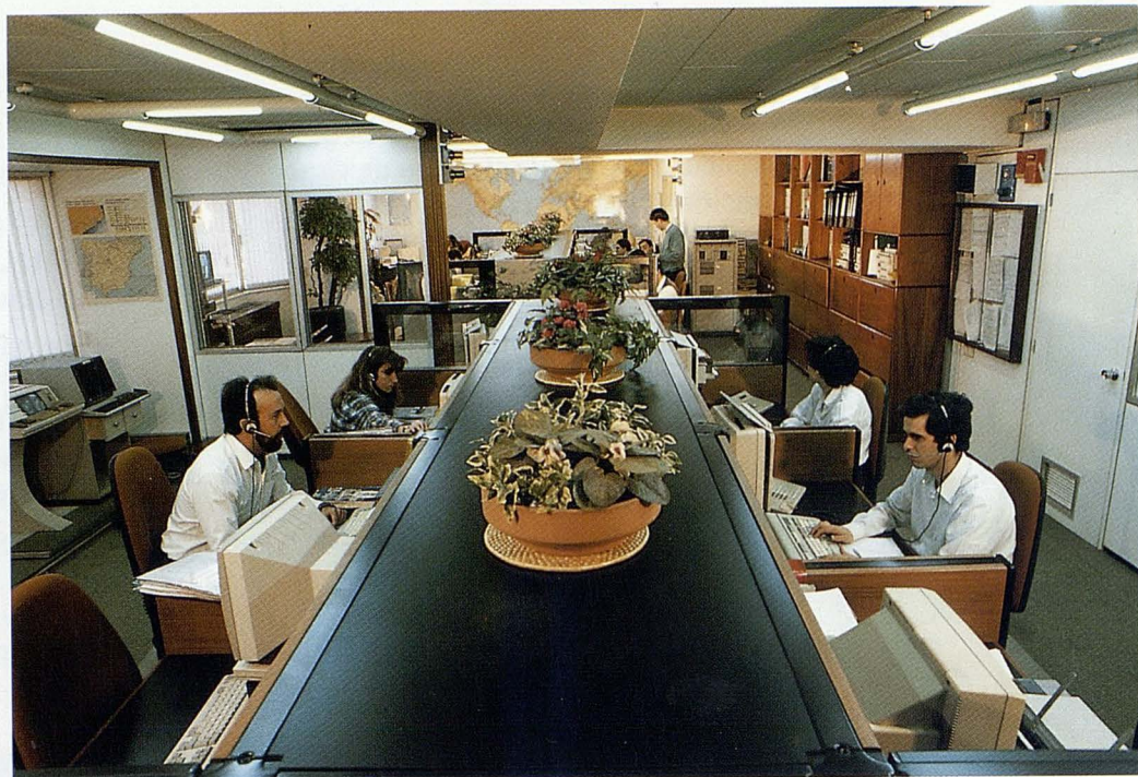
Central de Alarma de Mapfre Asistencia en Madrid.

• MAPLUX RE, entidad domiciliada en Luxemburgo, con ámbito de actuación internacional.