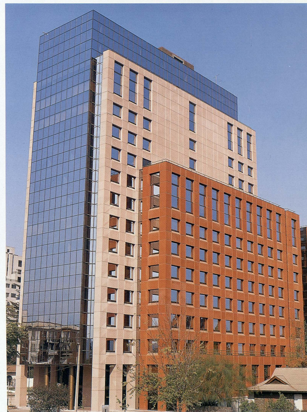
Sede de Caja Reaseguradora de Chile en Santiago.

• REASEGURADORA HEMISFÉRICA, S. A., con sede en Santafé de Bogotá, que opera en Colombia y Ecuador.