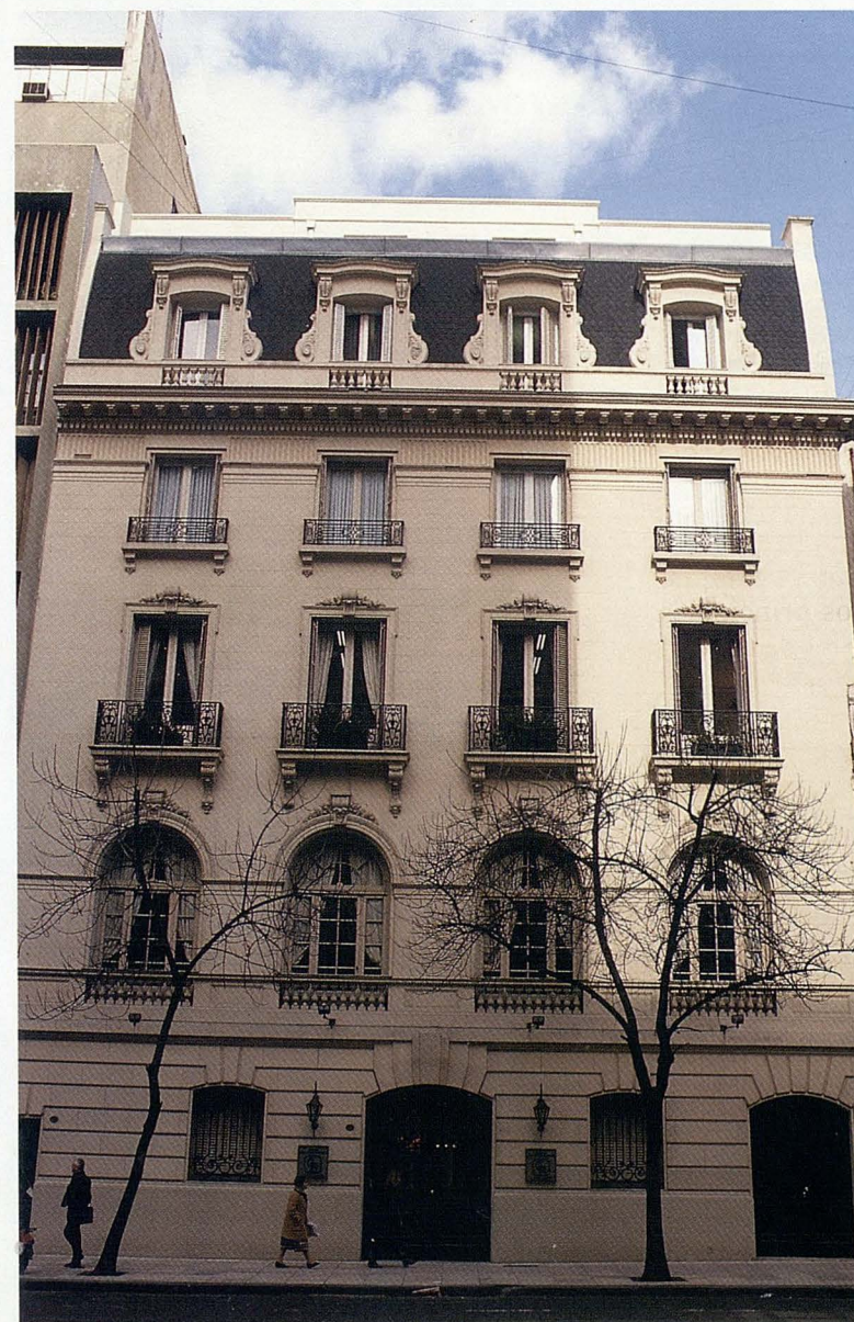
Edificio de Caja Reaseguradora en Buenos Aires.

mercado mundial de retrocesiones y protecciones, que obligará a los reaseguradores a operar en condiciones más razonables y acordes con la capacidad y servicios que ofrecen a los distintos mercados, y cuyas consecuencias para las cedentes han empezado a apreciarse ya en las renovaciones para 1993: