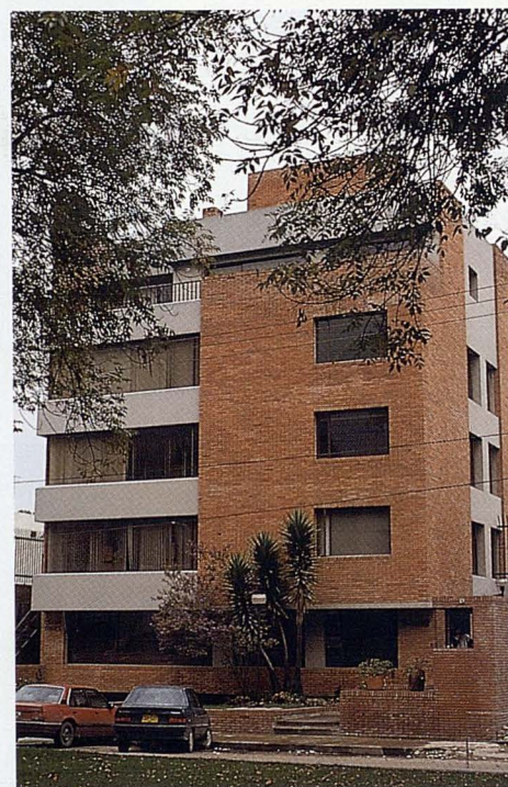
Edificio de Reaseguradora Hemisférica en Santafé de Bogotá.

A esta catástrofe hay que añadir otros grandes siniestros ocurridos en