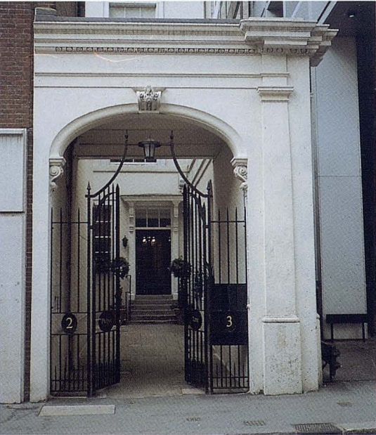
Entrada de Mapfre House en Londres.