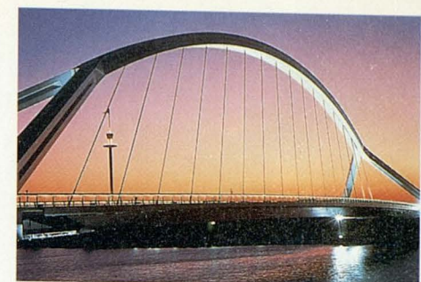
PUENTE MAPFRE. SEVILLA.

Vía Privata Mangili, 2 20121 MILÁN Teléf.: 655 44 12 Telefax: 659 82 01