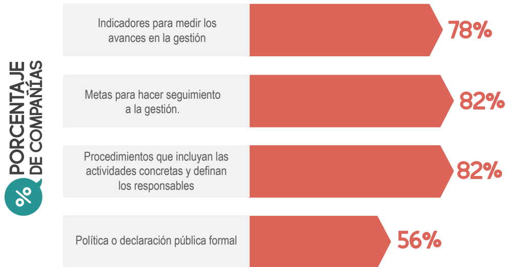
Gráfico 3. Mecanismos utilizados para la gestión de siniestros

Respecto de la inclusión de criterios ASG en la gestión de siniestros, la encuesta arrojó que algunas compañías ya han empezado a integrar estos temas en el manejo de salvamentos, de residuos