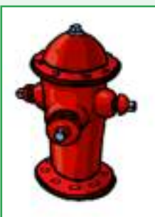
TOMA DE AGUA